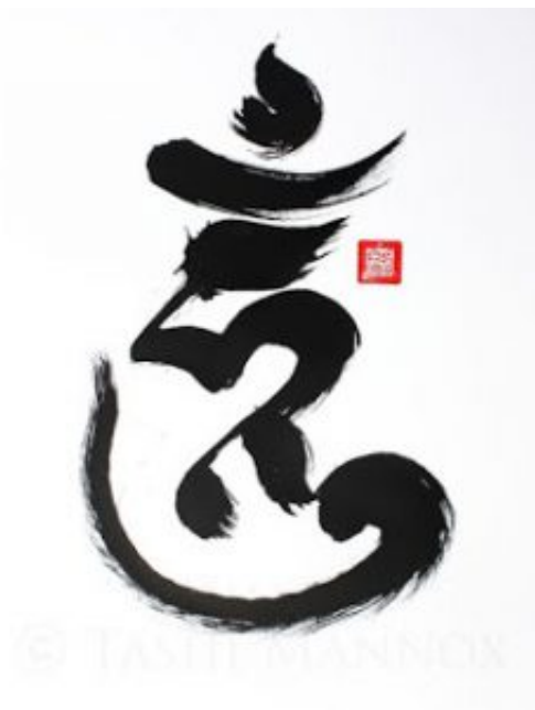
Wrathful HUM by Tashi Manno

*un ensō è una pratica di disciplina creativa della pittura tradizionale giapponese Zen, un cerchio disegnato a mano con una pennellata disinibita per esprimere un momento in cui la mente è libera di lasciare che il corpo crei.